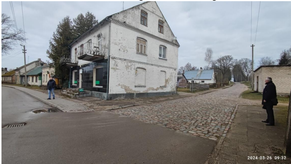
2 nuotr. Nemuno ir Stoties gatvių sankryža