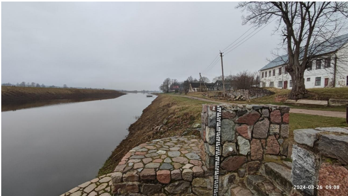
13 nuotr. Vandens matavimo įrenginys šalia Uosto gatvės