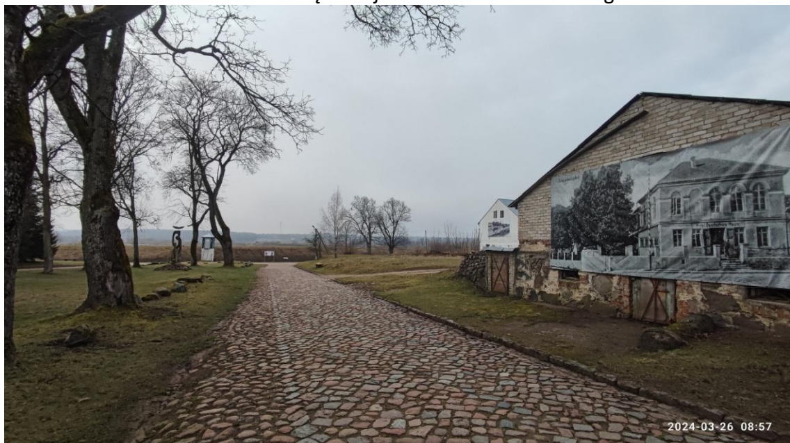
8 nuotr. Stoties gatvė link vandens matavimo stoties