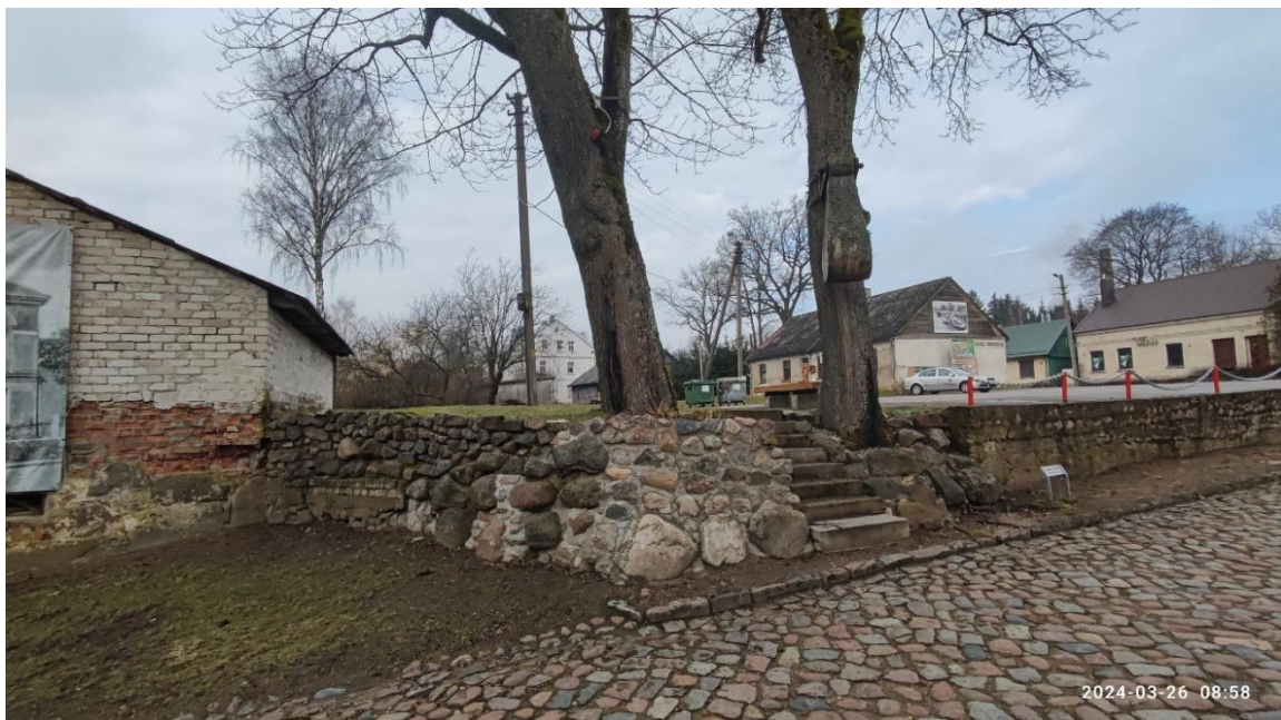
7 nuotr. Automobilių stovėjimo aikštelė šalia Stoties gatvės