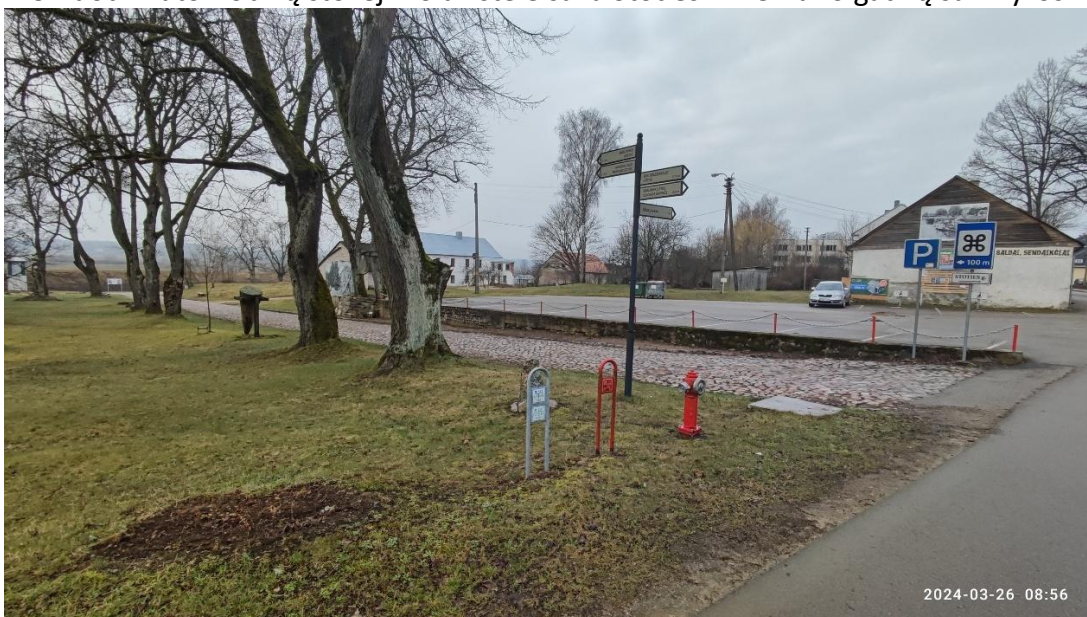
6 nuotr. Automobilių stovėjimo aikštelė šalia Stoties gatvės