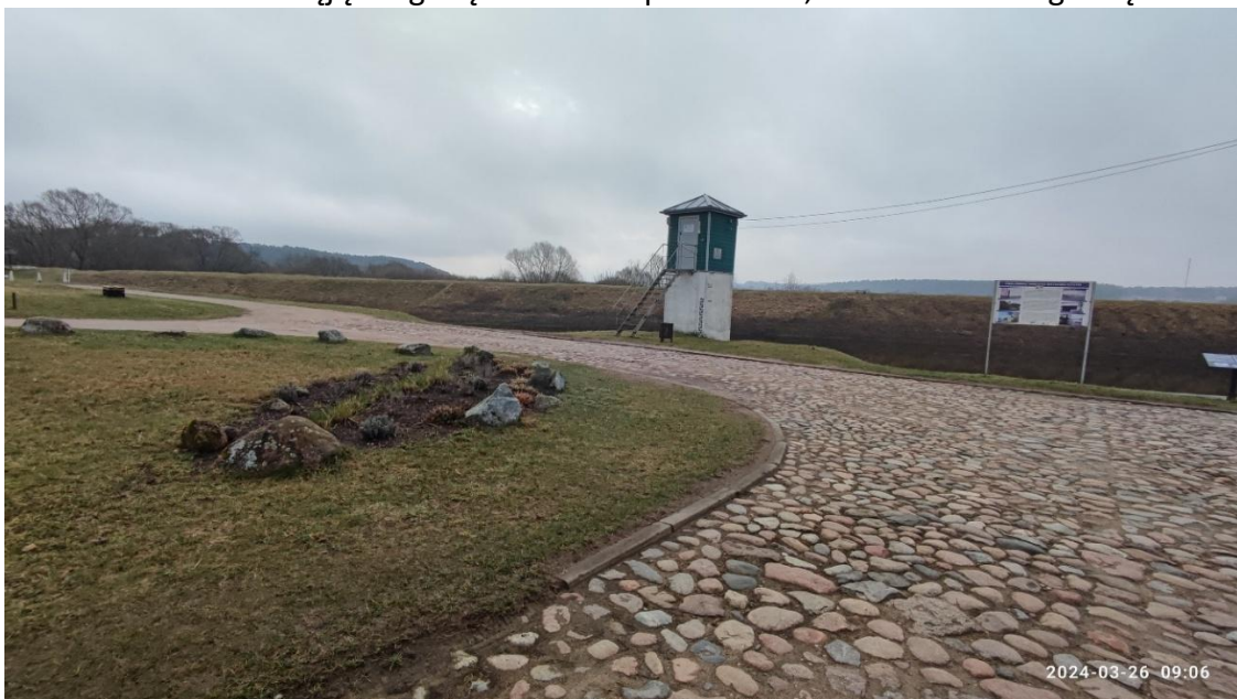
11 nuotr. Viešųjų renginių aikštelė tarp Krantinės, Uosto ir Stoties gatvių