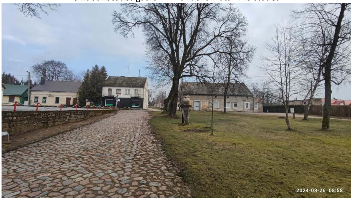
9 nuotr. Stoties gatvė link Nemuno gatvės