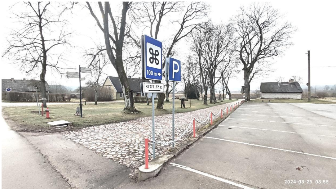
4 nuotr. Stoties gatvė link vandens matavimo stoties