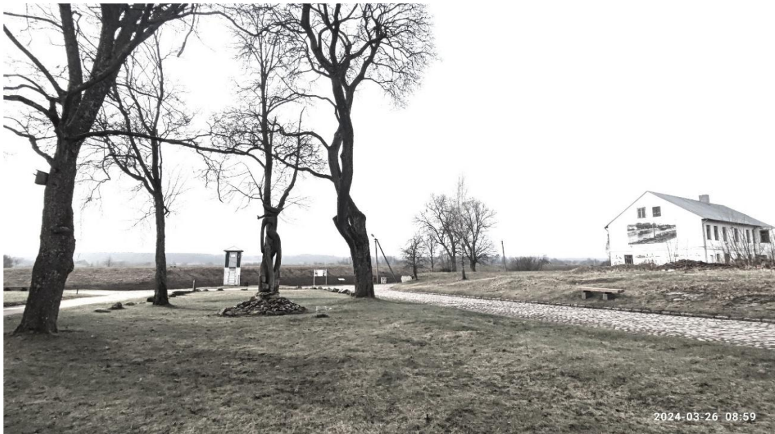
10 nuotr. Viešųjų renginių aikštelė tarp Krantinės, Uosto ir Stoties gatvių