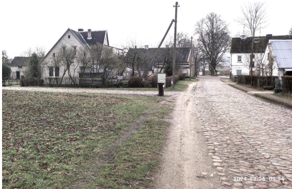
1. nuotr. Stoties gatvė link Nemuno gatvės