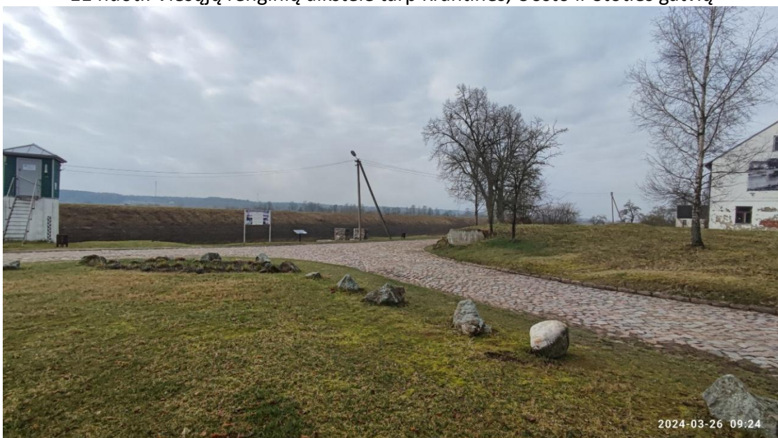
12 nuotr. Viešųjų renginių aikštelė tarp Uosto ir Stoties gatvių