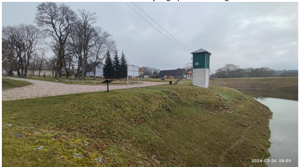
15 nuotr. Viešųjų renginių aikštelė tarp Stoties ir Uosto gatvių