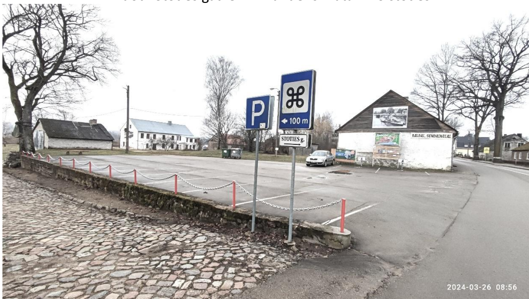
5 nuotr. Automobilių stovėjimo aikštelė šalia Stoties ir Nemuno gatvių sankryžos