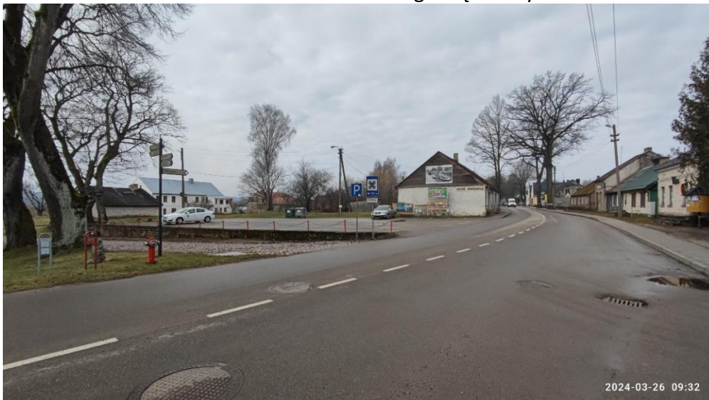
3 nuotr. Nemuno gatvė